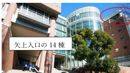
矢上入口の 14 棟